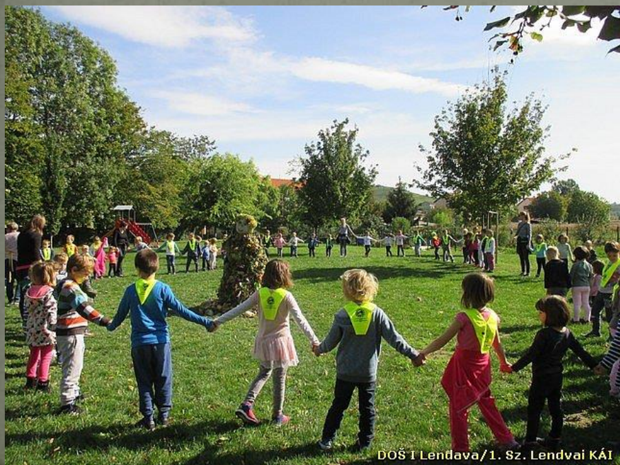
DOŠ I Lendava/1. Sz. Lendvai KAI

DOŠ I Lendava ima še podružnično šolo v vasi Gaberje. Skupaj s podružnico ima prb. 500 učencev.