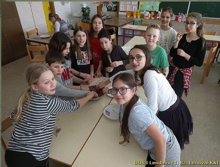
DOŠ I Lendava/1. Sz. Lendvai KÁI