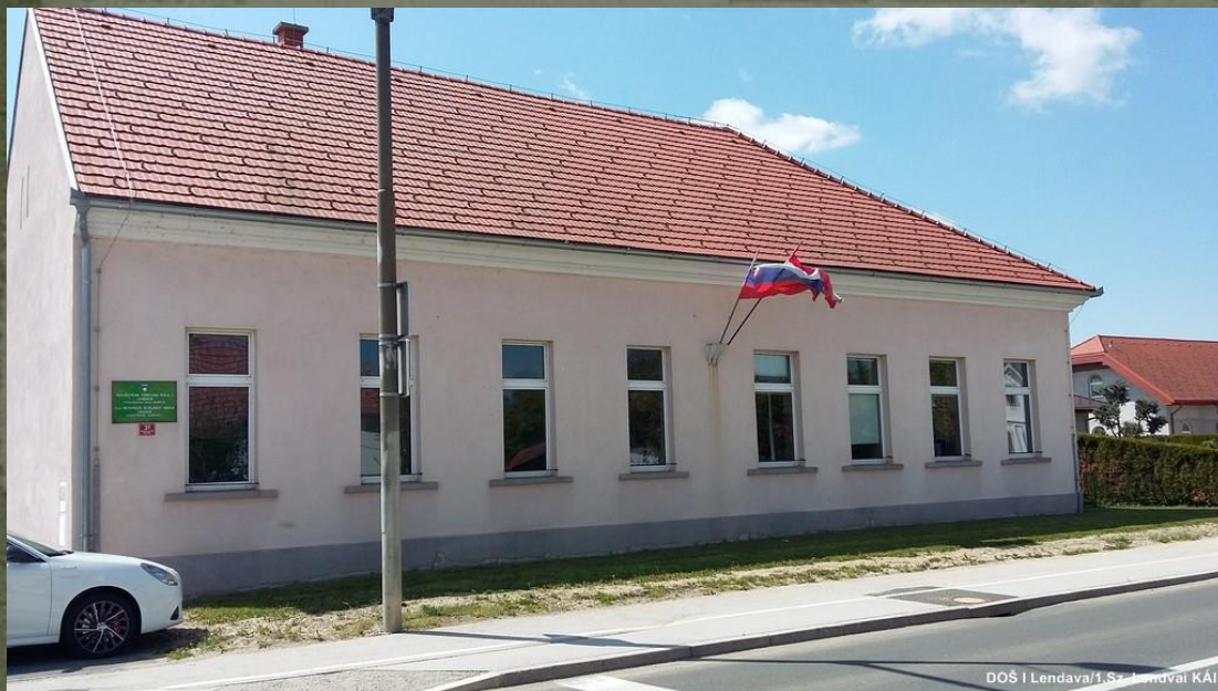
DOŠ I Lendava/1. Sz. Lendvai KAI

DOŠ I Lendava ima še podružnično šolo v vasi Gaberje. Skupaj s podružnico ima prb. 500 učencev.