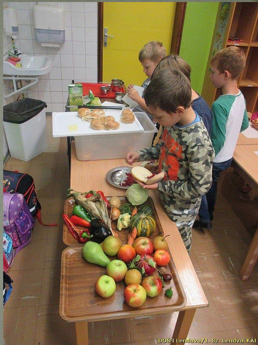
DOŠ I Lendava/1. Sz. Lendvai KÁI

Navdušenje otrok nad pripravo namazov je bil velik. Pripravili so jih učenci sami po receptu in navodilih učiteljice.