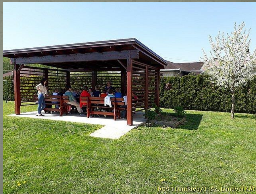
DOŠ I Lendava/1. Sz. Lendvai KAI